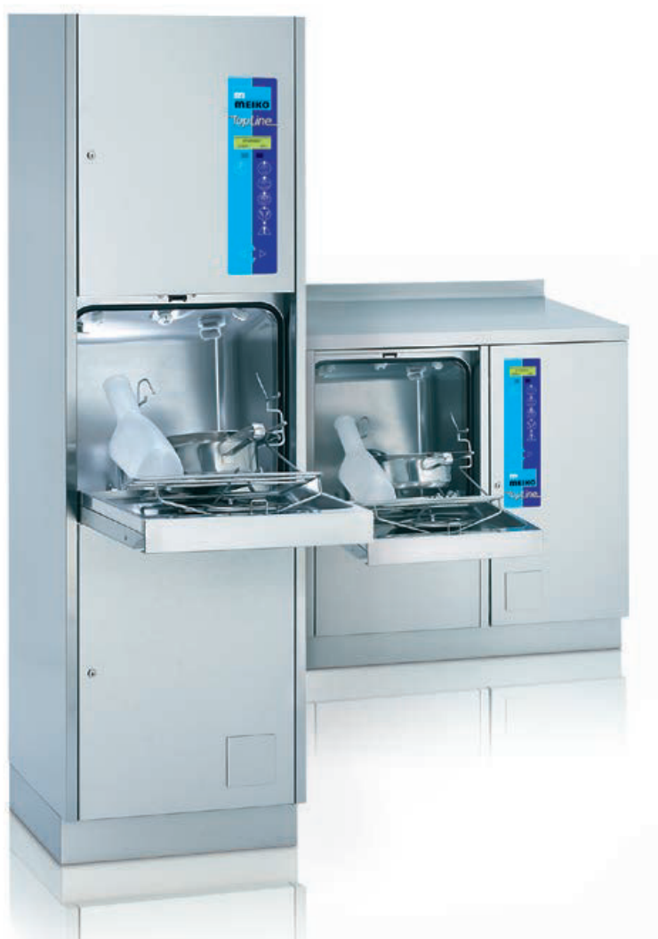
TopLine 20 Standgerät und TopLine 40 Tischmodell, mit automatischer Türöffnung (optional) und Fußschalter (optional).