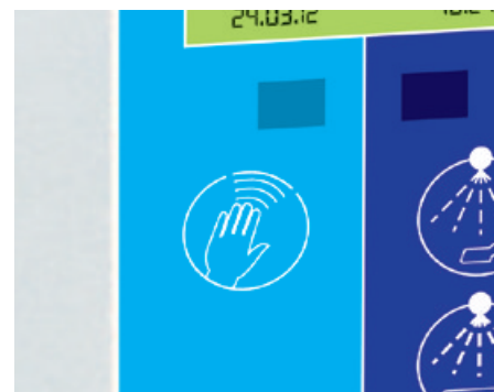
Näherungsschalter zum Öffnen und Schließen der Gerätetür (optional).